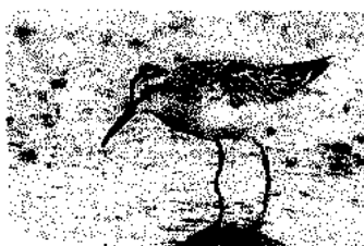
←今季見る機会が多い キリアイ (2024年9月19日)