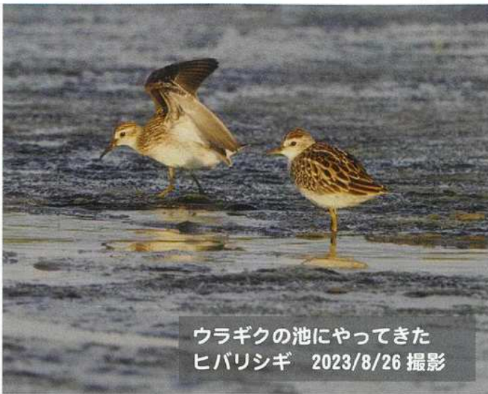
ウラギクの池にやってきた ヒバリシギ 2023/8/26 撮影