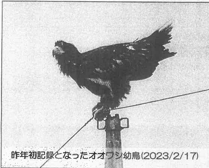
昨年初記録となったオオワシ幼鳥(2023/2/17)