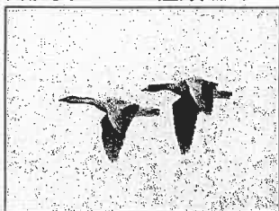
サカツラガン(左)とハイイロガン(11/30)

ただでさえ珍しいこの2種が行動を共にしているのは極めて珍しく、先に飛来したアボセットとの3ショットは、国内では奇跡的な風景でした。