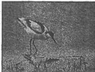
目の前にやってきたアボセット(11/18)

これまで飛来した個体は最長で7日間しか滞在しませんでした。この個体は1ヶ月以上も滞在し、滞在日数記録を大幅に刷新しました。