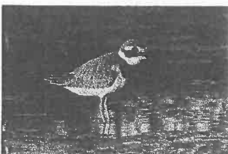
←6年ぶり3度目の ハジロコチドリ幼鳥 (2023年9月9日)