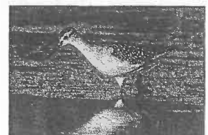
今季最多飛来したタカブシギ (2023年8月26日)

この秋はタカブシギが多く飛来し、8/26に15羽が確認されました。これまでの最多記録は9羽で、大幅に更新しました。