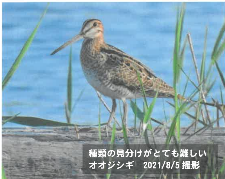
種類の見分けがとても難しい オオジシギ 2021/8/5 撮影