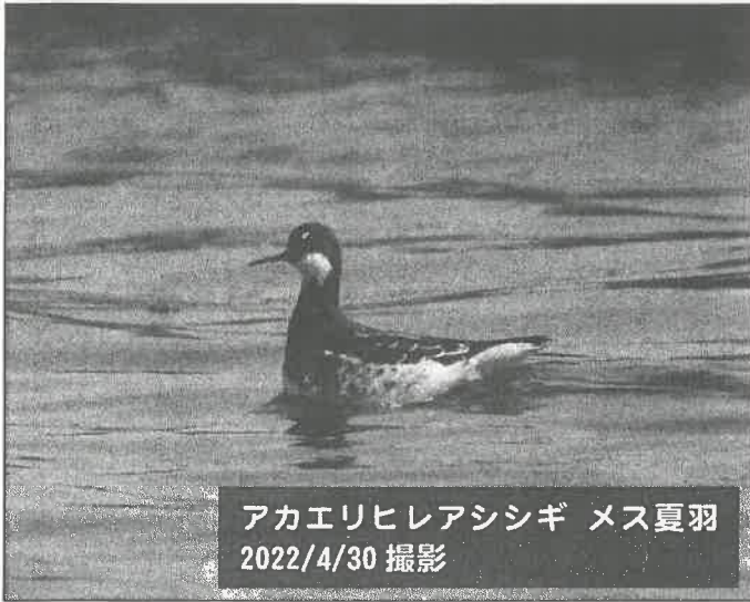
アカエリヒレアシシギ メス夏羽 2022/4/30 撮影