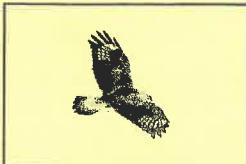
←5シーズンぶりに飛来した ケアシノスリ 2023/1/5撮影