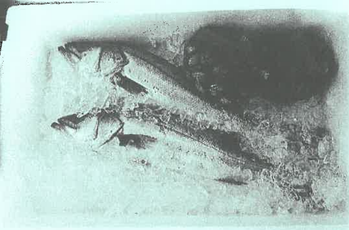
中海産のスズキとサルボウガイ

かつては多種多様な生き物が生息し、その景色がとても美しく「錦の海」と称えられた程であったとされる中海。中海は、長きにわたり多くの恵みを私達人間に与えてくれました。